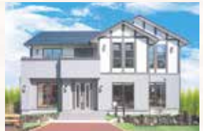
IRODORI 彩 [木造軸組在来工法] 高知県産の四寸角の柱と耐力壁で、強度と設計の自由度を高め、変形の土地などでも有利な木造軸組在来工法