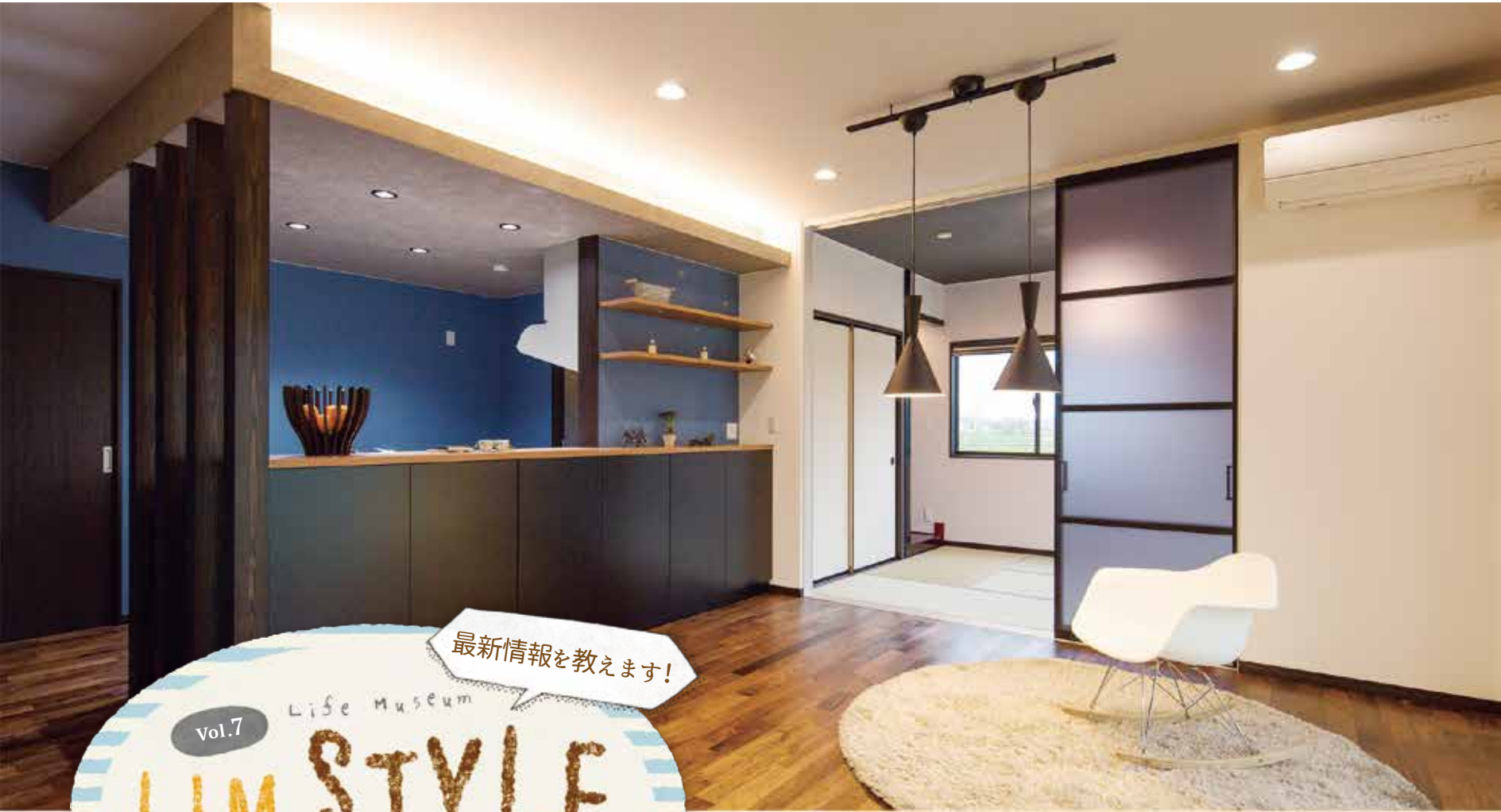
アカシアの床材と黒で統一したキッチンが印象的なヴィンテージスタイルのダイニングキッチン。奥には6畳の和室も