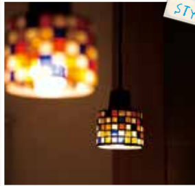
色とりどりのステンドグラスで作られたペンダントライトは部屋のアクセントに