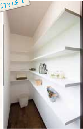
白で清潔感のあるキッチン裏のパントリーは、縦を十分に使うことでスッキリと収納できる優れたもの！

住む人の趣味や好みを引き出してくれるウッドホームは、快適な住まい環境もご提案していますので、ぜひライムのモデルハウスでお確かめください。