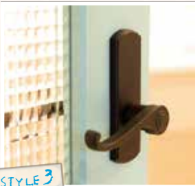
アンティーク調のドアに取り付けられたブラウンのノブ。レトロで女心をくすぐります