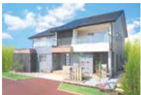
夢空間「プレシャスファイン」